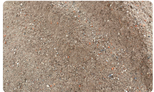
Recycling Sand 0-8mm